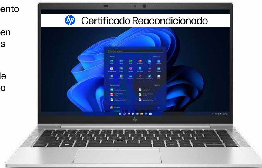
HP EliteBook 840 G7 Certified Refurbished PC